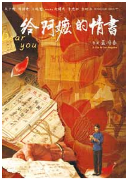
《给阿嬷的情书》宣传海报

信纸能有多重？如果只论克重，它轻若无物；可若论其所承载的东西，它可以是压在一个女人床头五十年的信念，是一个家族跨越战乱与重洋的根脉，更是一座城市的文化脊梁。