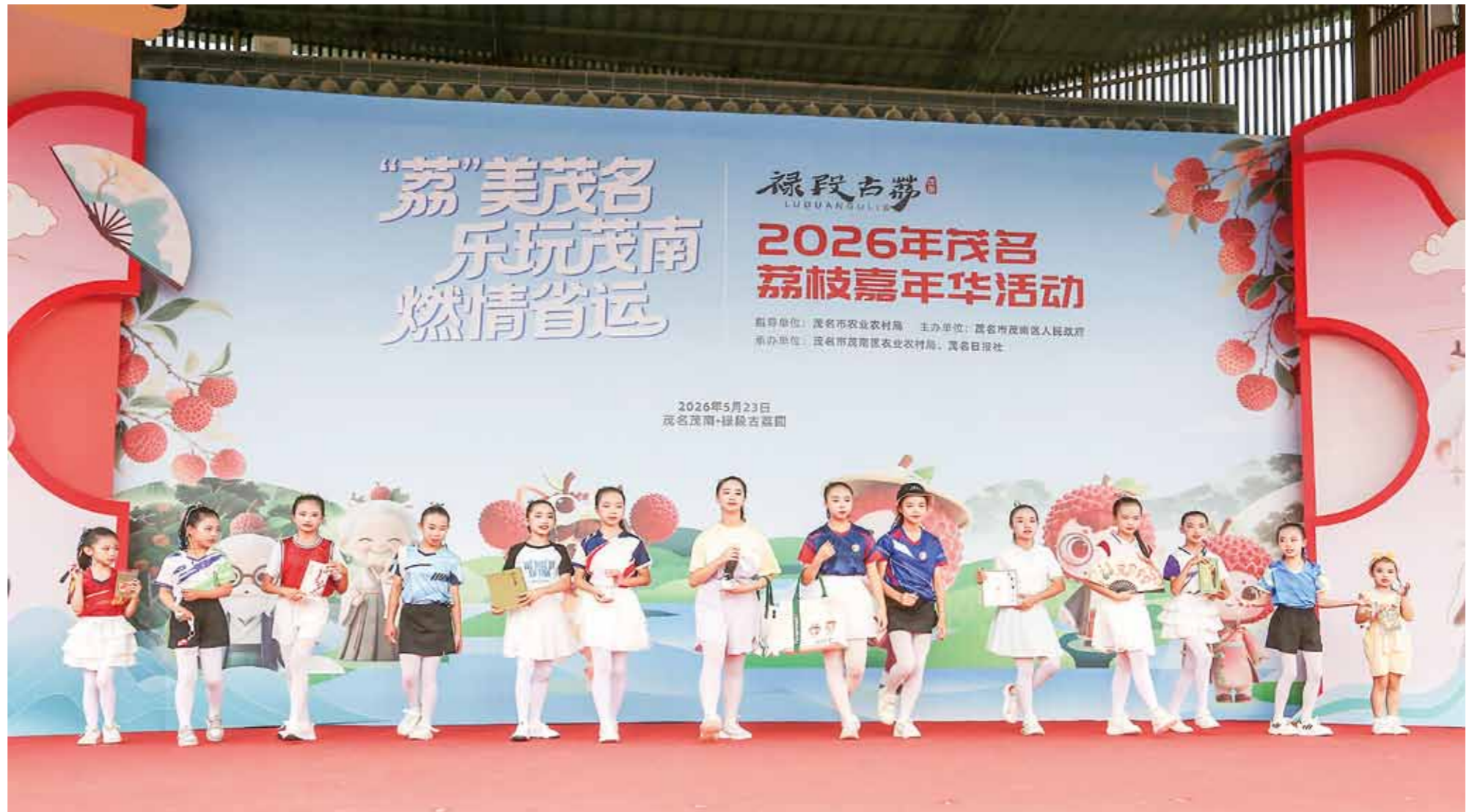
茂名市奥之羽艺术中心的少儿运动模特展示茂南荔枝家族IP文创产品。