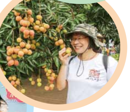
▲活动参与者着看满树荔枝。