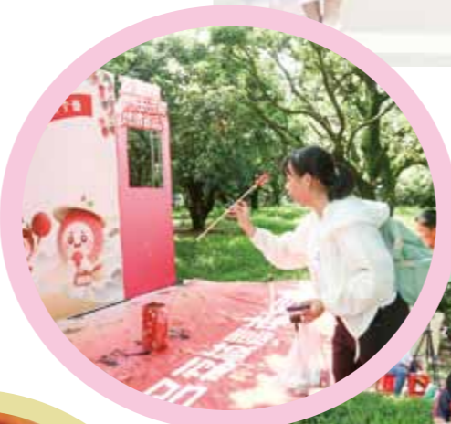
▲车田园荔枝IP主题投篮游戏。