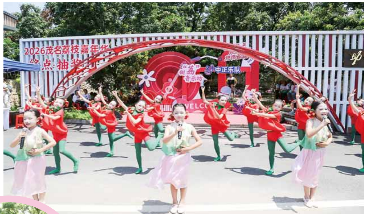
茂名市茂南第一小学学生跳唱《荔枝妹》。