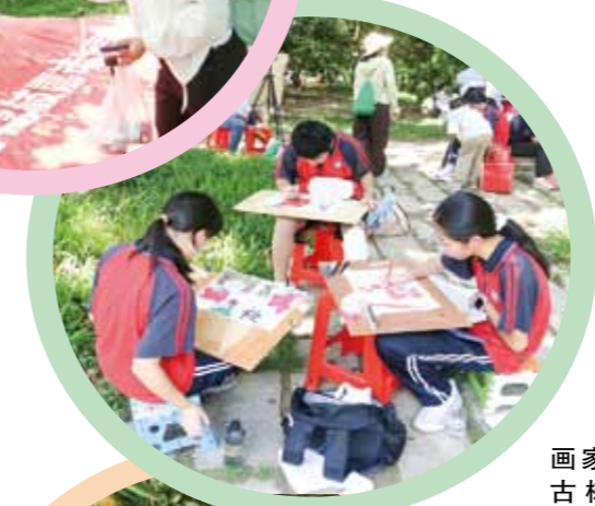
▲小画家围坐古树下，参加千年“荔”像·童绘古树活动。