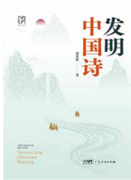
《发明中国诗》 谭夏阳 著

摩尔深爱中国诗,是众多欧美 诗人中,最受中国诗激励影响的 一个。她本人虽然从未到过中国, 但对中国充满向往,她的许多诗 歌都提到过中国,都涉及中国意 象。由于对中国的喜爱,她不断 断研究与中国有关的文化。她毫 不掩饰自己对中国艺术的偏爱, 多次到博物馆参观中国书画展, 从1940—1950年代,参观了 数十次关于中国文化的展览,甚 至收藏中国瓷器、灯具、钱币、 茶几、木