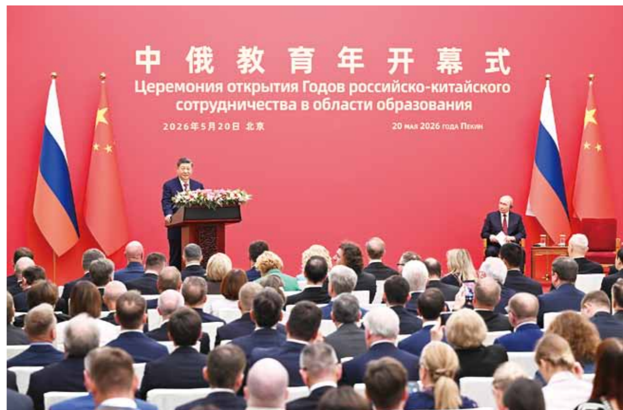
5月20日下午，国家主席习近平同俄罗斯总统普京在北京人民大会堂共同出席“中俄教育年”开幕式。

努力下，“中俄教育年”必将取得圆满成功。 普京表示，教育合作是两国全面战略协作伙伴关系不可或缺的重要组成部分，启动“俄中教育年”具有里程碑意义。俄中两国都重视教育，教育不仅对个人发展至关重要，更是国家经济社会发展的基础。“俄中教育年”活动内容丰富、规模宏大。俄方愿同中方一道，通过加强教育合作，增进青年一代的彼此了解，让俄中友好事业后继有人，推动俄中关系取得更大发展。 两国元首共同为“中俄教育年”徽标揭幕。 蔡奇、丁薛祥、王毅、何立峰、张国清、谌贻琴等参加。