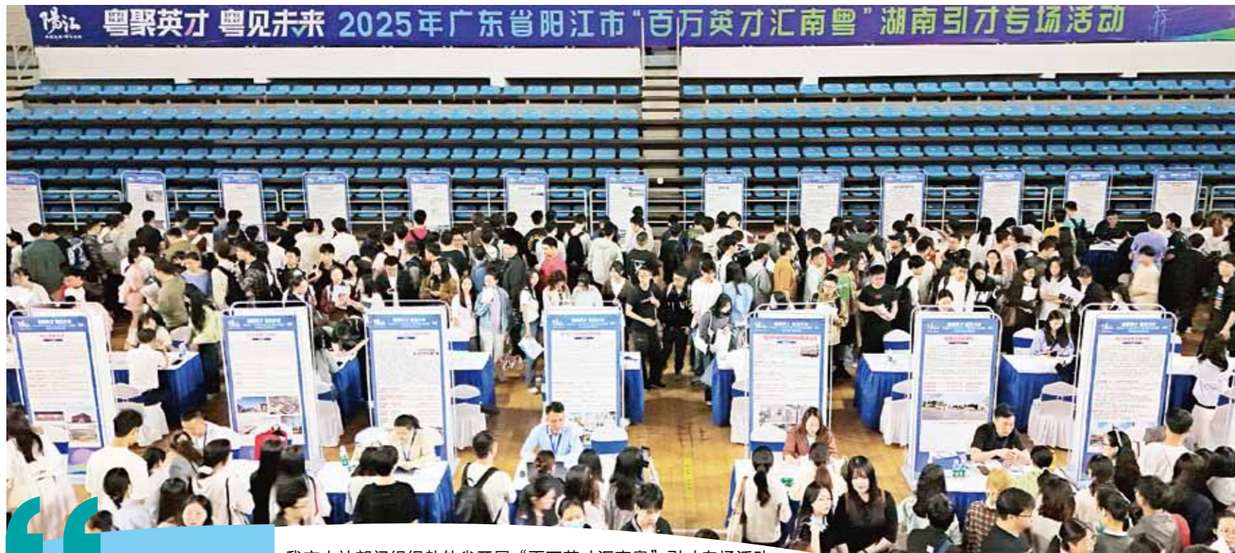
我市人社部门组织赴外省开展“百万英才汇南粤”引才专场活动。