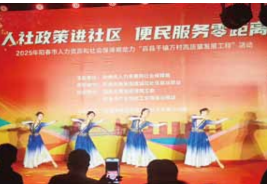
我市人社部门举办“人社政策进社区 便民服务零距离”为主题的惠民晚会。