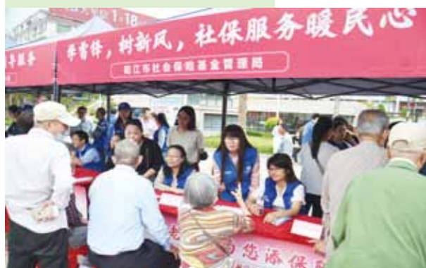
我市人社部门组织志愿者在市人民广场开展“学雷锋 树新风 社保服务暖民心”惠民政策宣传活动。

人才引育方面，引进高层次紧缺人才1146人，建成博士工作站58家，柔性引才人次完成率达131.60%。