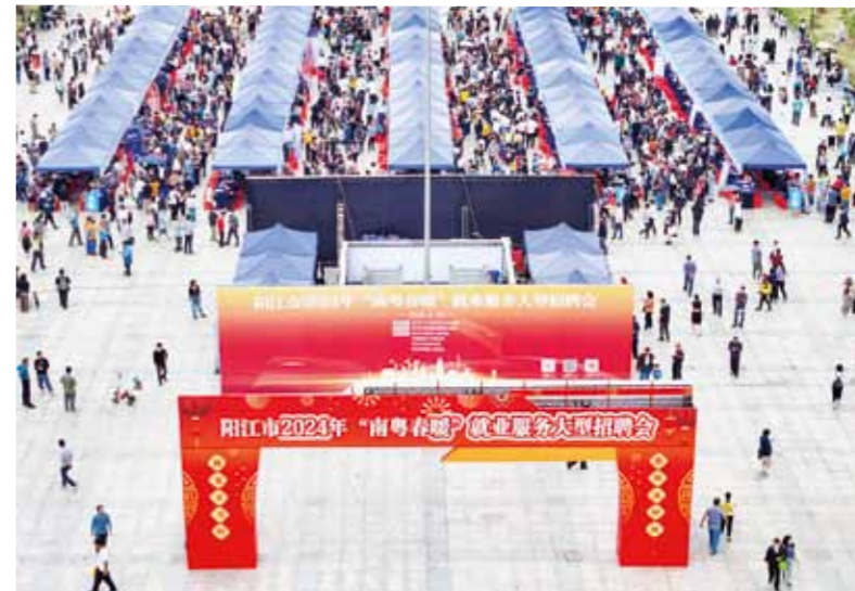
我市人社部门开展“南粤春暖”大型就业服务招聘会。