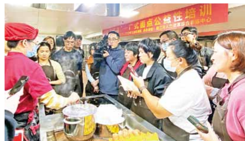
我市人社部门组织开展广式面点公益性培训。

2023至2025年，是广东省“百县千镇万村高质量发展工程”三年初见成效的关键时期。市人力资源和社会保障局锚定“城乡协调、民生改善、产业赋能”核心目标，将人社职能深度融入“百千万工程”战略布局，以就业扩容、技能提质、人才集聚、社保兜底为四大支点，真抓实干、创新突破，用三年时间交出了一份“民生有温度、发展有力度”的亮眼答卷。