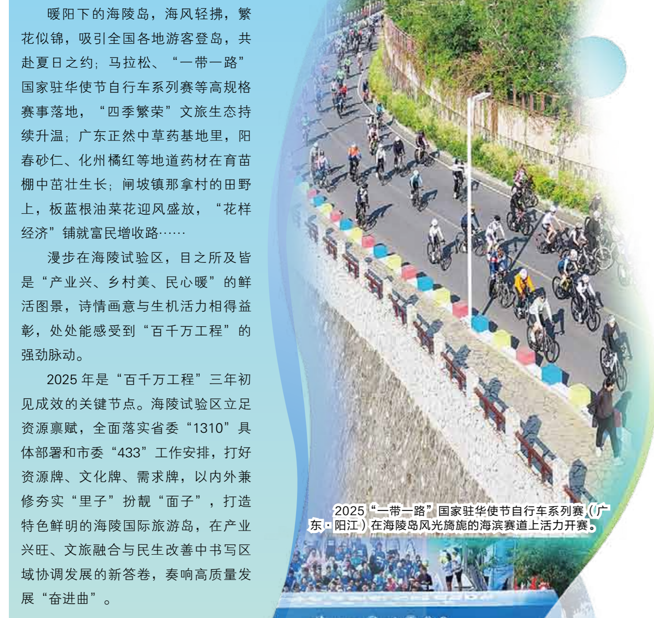
2025“一带一路”国家驻华使节自行车系列赛（广东·阳江）在海陵岛风光旖旎的滨海赛道上活力开赛。

如今，“百千万工程”三年初见成效的生动画卷正徐徐铺展，激荡起城乡区域发展的澎湃浪潮。未来，海陵试验区将以改革创新为笔，续写高质量发展新篇章，为人民幸福生活添彩赋能。