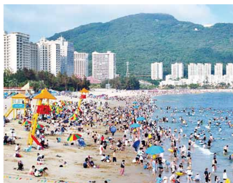
游客在大角湾景区尽情戏水玩耍。