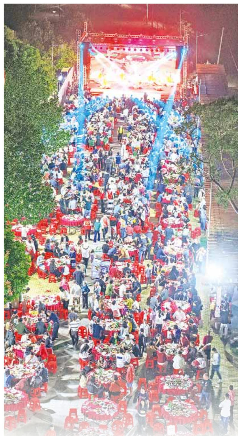
2025年那龙镇首届田畔黄牛美食文化活动成功举办。