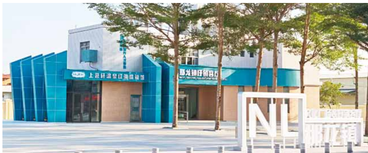
那龙镇美丽圩镇客厅。