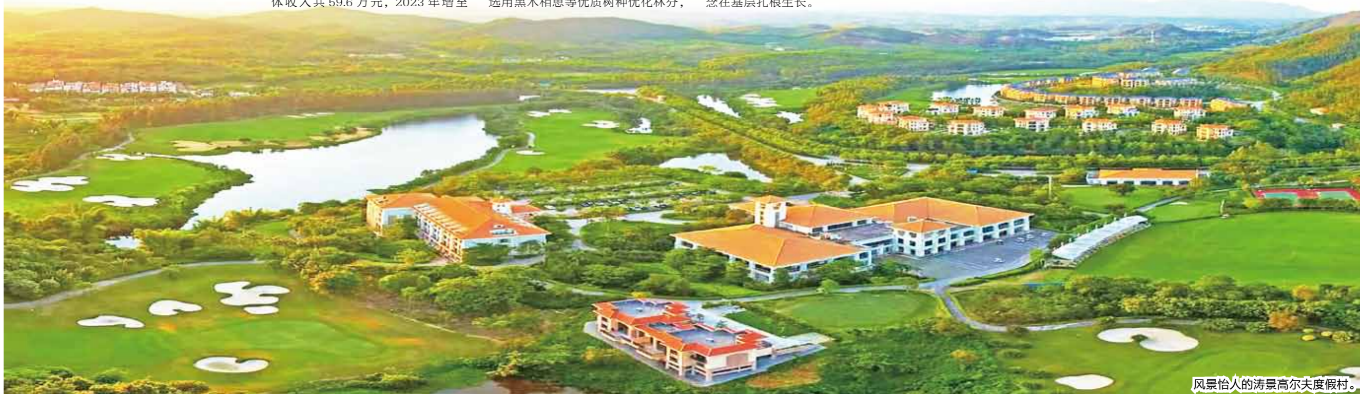
风景怡人的涛景高尔夫度假村。