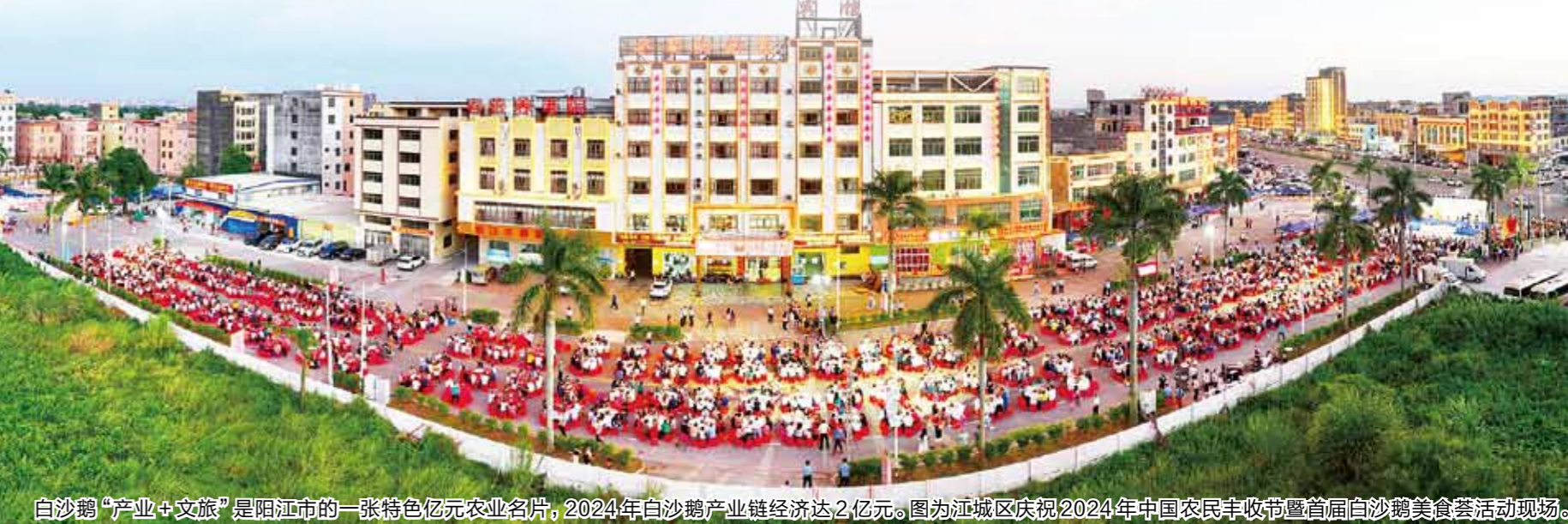
白沙鸕“产业+文旅”是阳江的一张特色亿元农业名片，2024年白沙鸕产业链经济达2.4亿元。图为江城区庆祝2025年中国农民丰收节暨首届白沙鸕美食荟活动现场。