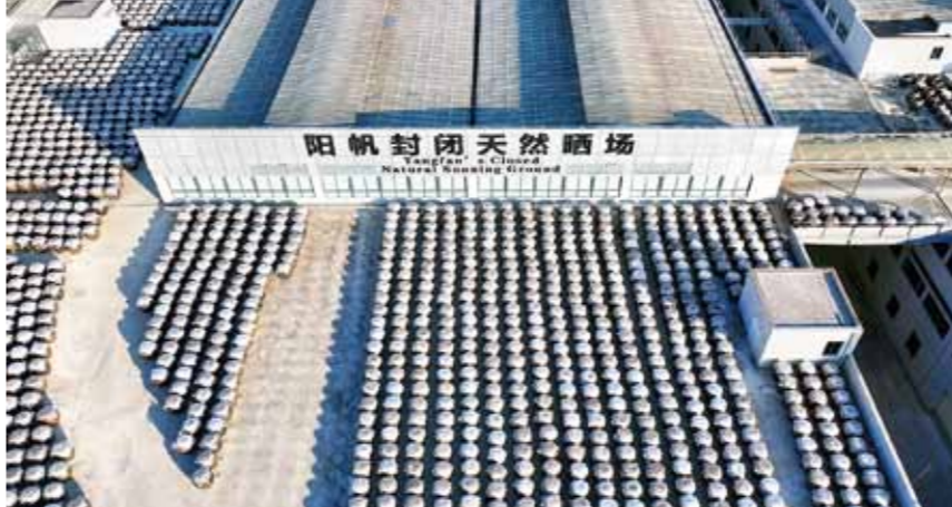
2025年，江城区成为我市第二个成功入选广东省食品工业培育试点县（市、区、镇）的县区。图为绿色食品工业集群骨干企业——广东阳帆食品有限公司的豆豉天然晒场。