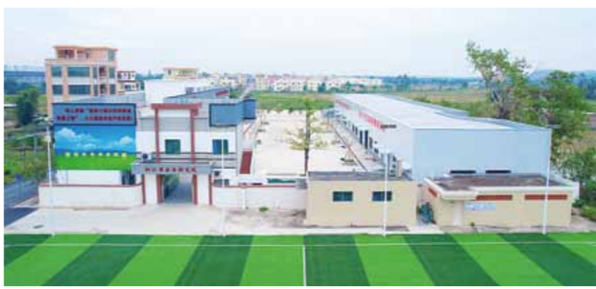
2025年8月19日，阳江市禾虫研究院正式建成启用，标志着江城区禾虫产业向标准化、专业化、规模化、品牌化发展。