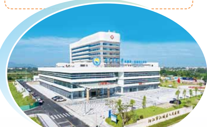
2024年，江城区与广东药科大学附属第一医院托管共建江城区人民医院，省城三甲医院优质医疗资源下沉，加快实现“大病不出县、区”的目标。

建成风貌提升示范带11条，改造老旧小区88个，农村公路新建完成133.947公里；累计植树约15万棵，空气质量达标率97%。投入近6亿元新建江城第一中学，全区小学校“六无”问题全部解决，组建5个教育集团、2个城乡义务教育共同体，2个教育集团列入广东省优质基础教育集团培育对象；同质化平移广东药科大学附属第一医院260余项新技术、项目。