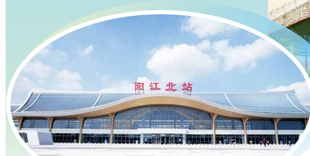
2025年12月22日，广湛高铁正式通车，阳江北站同步启用，江城融入大湾区“1小时交通圈”。