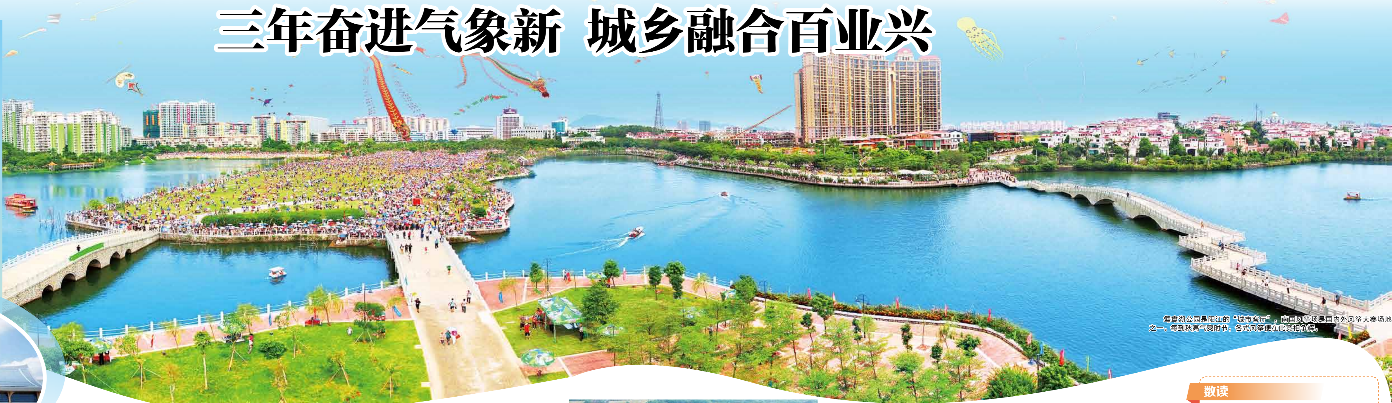
鸳鸯湖公园是阳江的“城市客厅”，南国网球场是国内外风筝大赛场地之一。每到较高气象时节，各式风筝便在此竞相争舞。

推动高质量发展，必须解决好城乡区域协调发展这一时代课题。江城区深入推进“百千万工程”，以三年生动实践，给出了掷地有声的“江城答卷”。