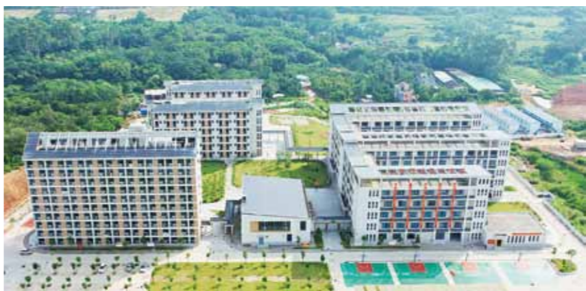
江城区是“全国义务教育发展基本均衡区”“广东省教育强区”和“广东省推进教育现代化先进区”。2024年4月，江城第一中学一期建成并正式投入使用。江城区新增1000个高中学位，有效缓解江城区“高中入学难”问题。

“老有所养”是民生服务提升的重要抓手。江城区持续强化养老机构服务能力，通过政策扶持、资源整合、标准提升，构建起多层次、专业化的机构养老服务体系。目前，全区已建成运营13家标准化养老机构，配备机构床位2168张，护理床位1677张。针对失能、半失能老人照护需求，推动优质教育资源向乡村和薄弱学校流动，让“上好学”的期盼照进每个家庭。医疗保障关乎人民健康福祉。医疗保险关乎人民健康福祉。