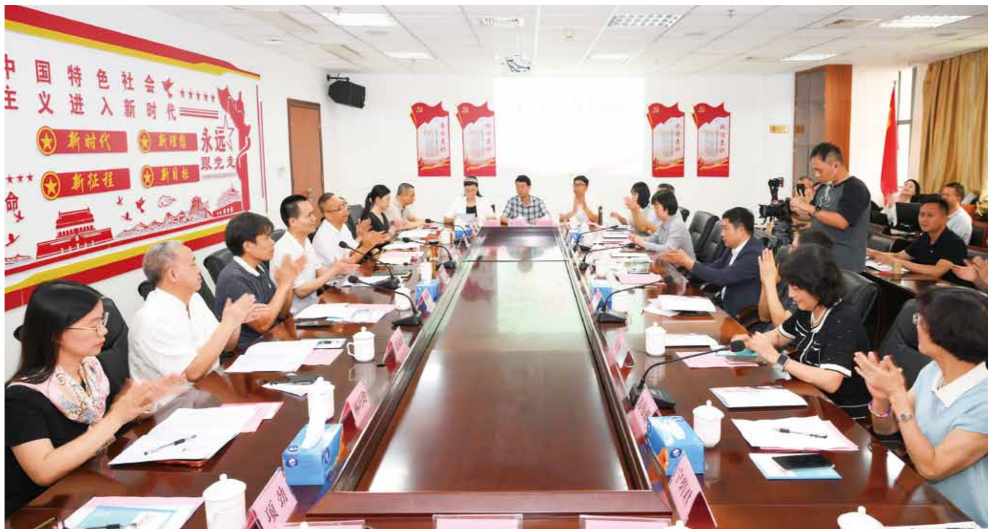
评委、嘉宾、副刊作者代表在阳江日报社第三届“百花园文学榜”发布表彰暨副刊“百花园”出版5000期座谈会上交流。