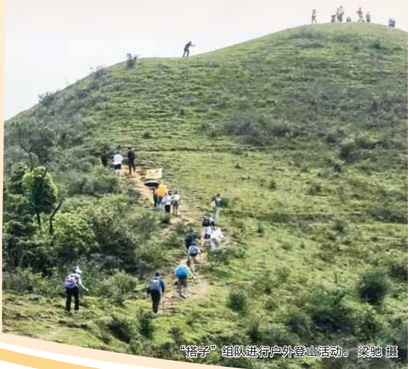
“搭子”组队进行户外登山活动。

和维系“搭子”关系时,要保持理性与警惕。线上匹配“搭子”时,注意保护个人隐私,线下见面选择安全、公开的场所;明确双方的社交边界,尊重彼此的生活习惯与个人空间,不过度窥探、不强行捆绑;秉持真诚相处的原则,拒绝功利化交往,让“搭子”关系保持纯粹与舒适。