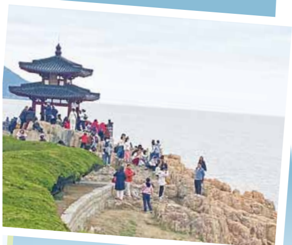
不肯去观音院东侧海边的滄滄亭。