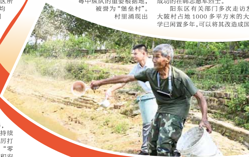
“开心农场”里两位退役军人在给塘鱼喂饲料。

接下来，阳东区将把各镇的红色资源摸清家底、串珠成链，在美丽乡村建设中积极融入国防教育要素，在阳东逐步织起一张覆盖城乡的国防教育网络。