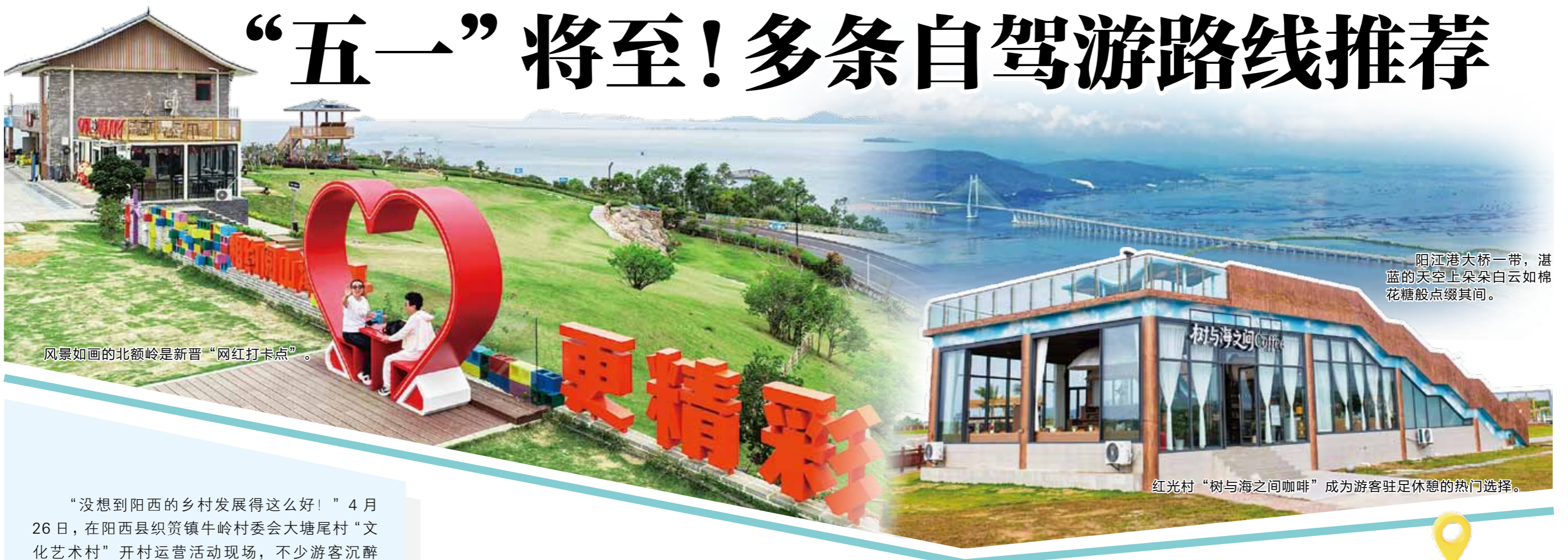
风景如画的北额岭是新晋“网红打卡点”。