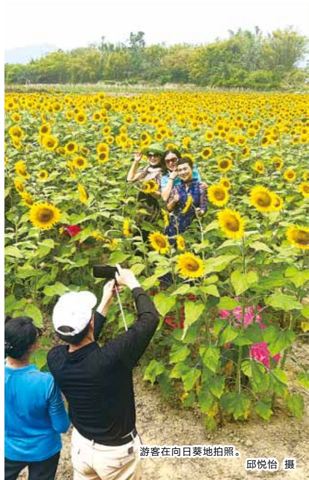
游客在向日葵地拍照。

不仅如此，阳江人露营度假的方式还有些“新潮”。越来越多市民选择骑上单车，欣赏春日风景，再寻一处心仪的营地，“住”进大自然中。这种将户外运动与精致露营深度融合的新玩法，成为阳江人拥抱春天的新姿势。