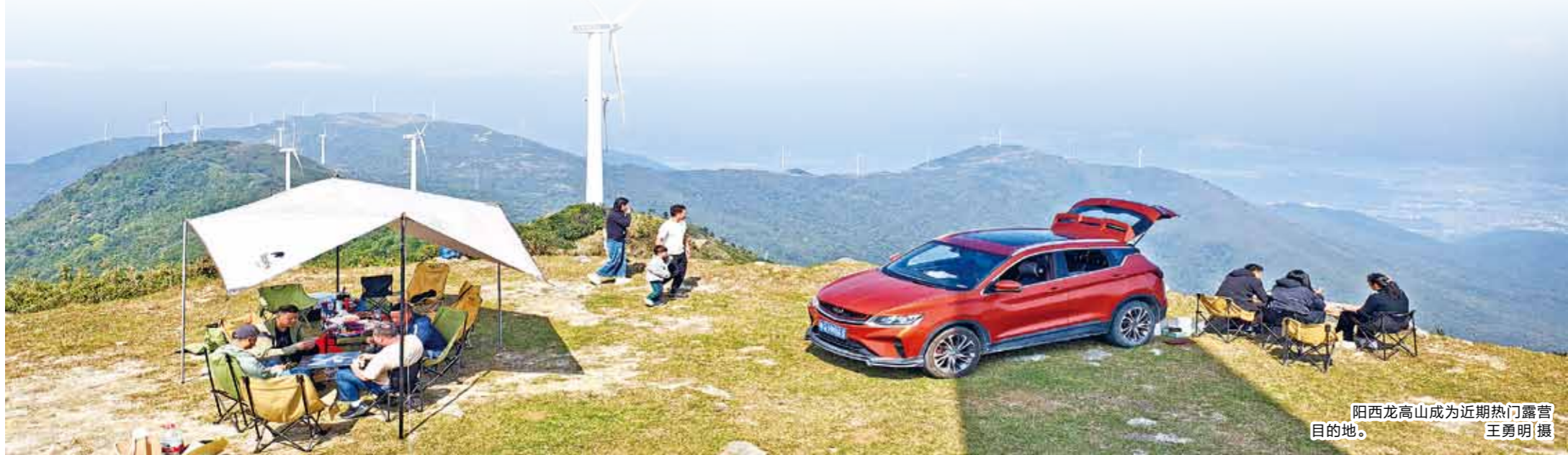
阳江龙高山成为近期热门露营地。