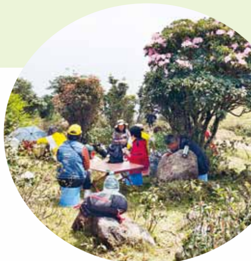
一边赏花一边野餐，市民春游野趣多。