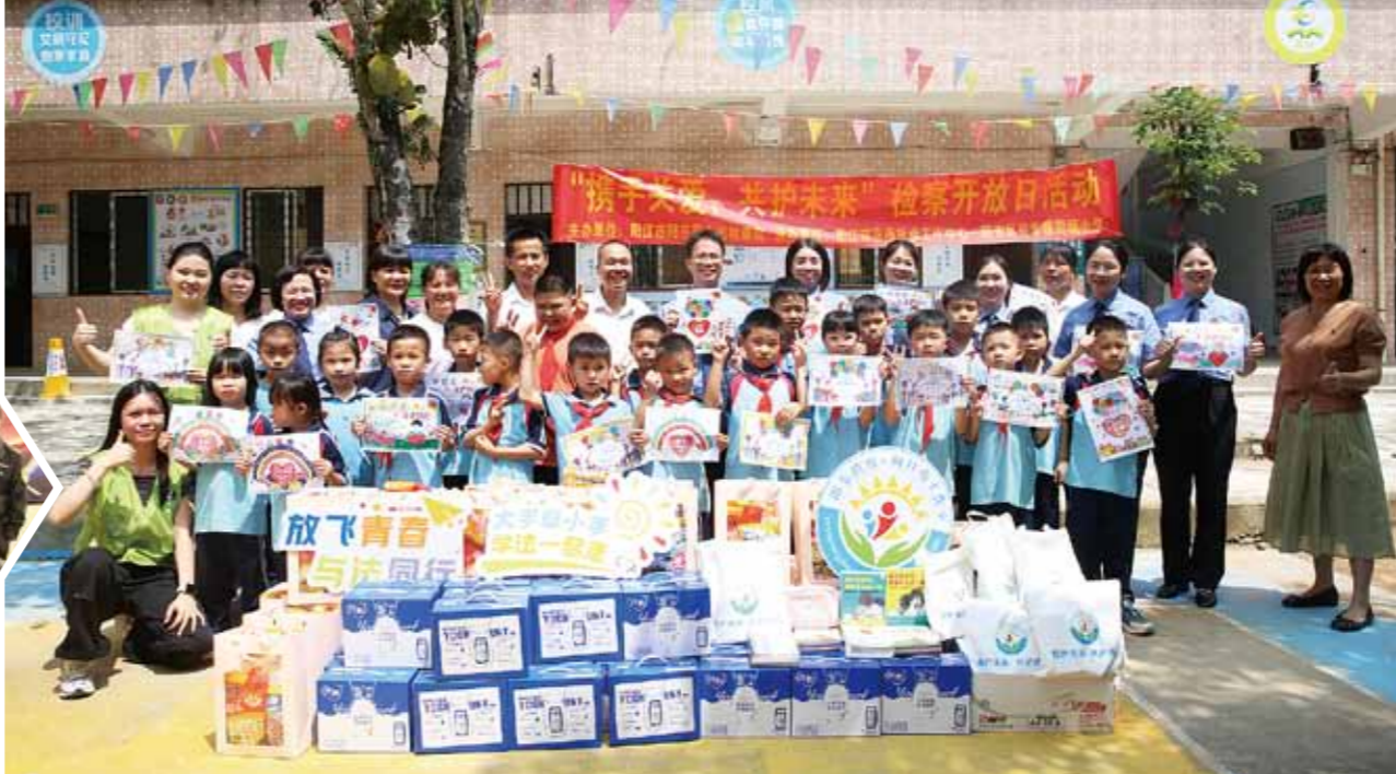
阳东区检察院举办检察开放日活动。