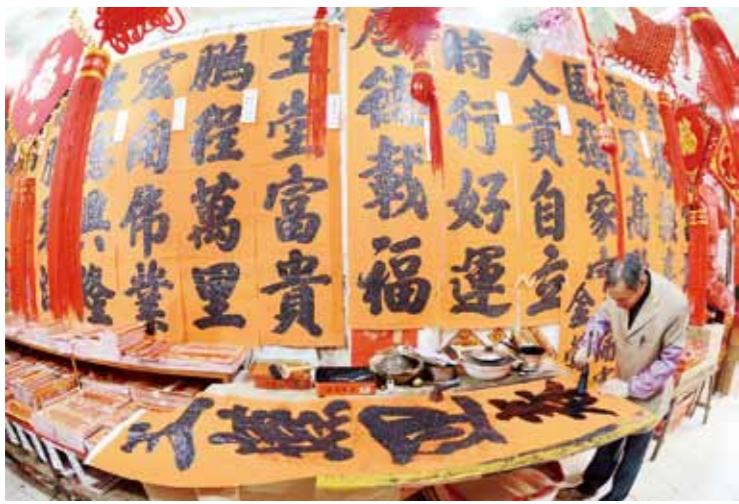
阳江崇尚手写春联，图为民间书法爱好者在书写春联。

马年春节很快要到了，又是家家户户张贴春联迎新春纳福的日子。想起了30年前亲历的一段和阳江春联有关的故事。