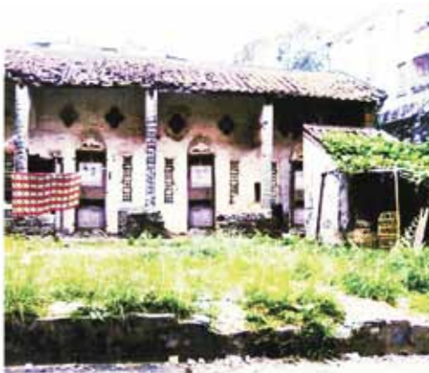
阳江考棚的“格子房”