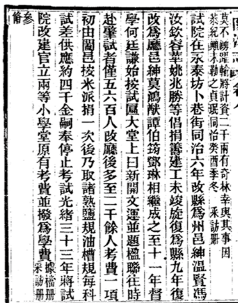
民国《阳江志》对阳江考棚的记载

每当过大年，城中百姓，尤其是年轻一代，初一“斥”瘟神之后，由零时开始，朝大利方向绕行阳城，一直行到日出。他们边走边鸣鞭炮，有的还手持一束桃花，以示花开富贵，行上“桃花运”；有的在路边买几条刚上镜的红薯，以示鸿运当头、时（薯）来运转。有的人家过年挥毫写的春联，也祈求“春夏秋冬行好运，东南西北遇贵人”。