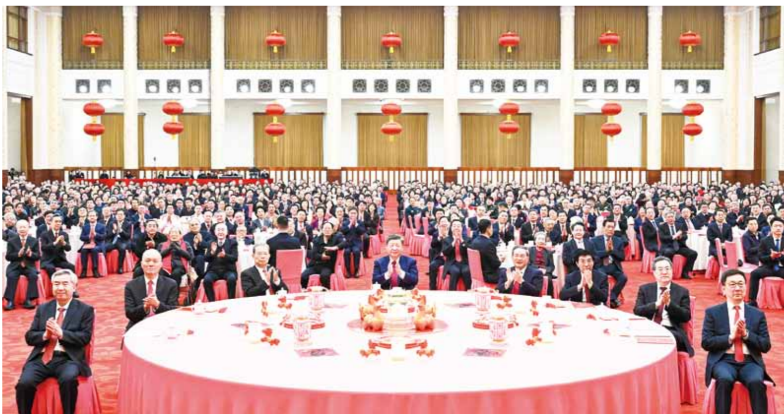
2月14日,中共中央、国务院在北京人民大会堂举行2026年春节团拜会。党和国家领导人习近平、李强、赵乐际、王沪宁、蔡奇、丁薛祥、李希、韩正等同首都各界人士欢聚一堂、共迎佳节。

新华社北京2月14日电 中共中央、国务院14日上午在人民大会堂举行2026年春节团拜会。中共中央总书记、国家主席、中央军委主席习近平发表讲话,代表党中央和国务院,向全国各族人民,向香港特别行政区同胞、澳门特别行政区同胞、台湾同胞和海外侨胞拜年。 习近平强调,即将过去的乙巳蛇