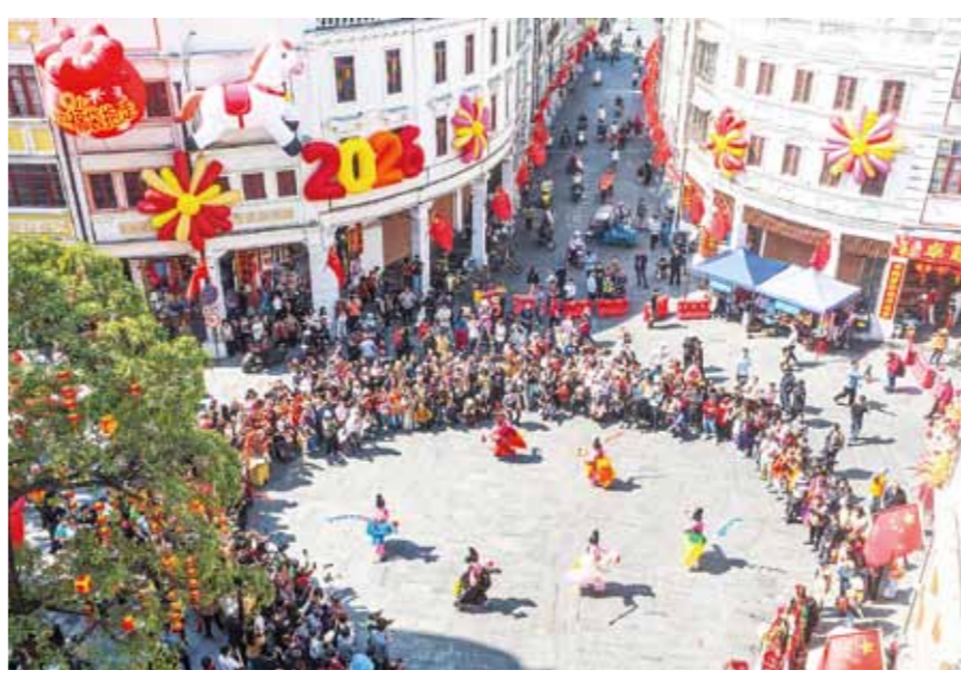
阳江春节民俗巡游队伍来到十字街,受到市民游客热捧围观。