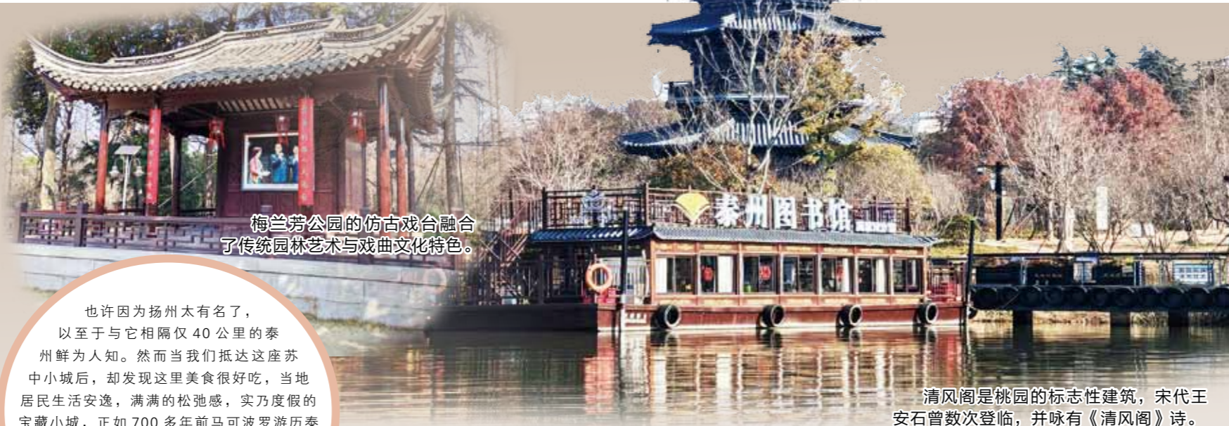
梅兰芳公园的古戏台融合了传统园林艺术与戏曲文化特色。